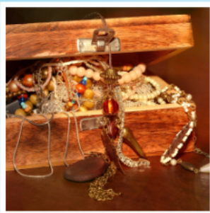
Mystery Rooms, Interlaken: Escape Rooms und Stadt-Ralleys