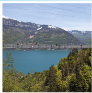
Wandern, z.B. zur Panoramabrücke Leissigen